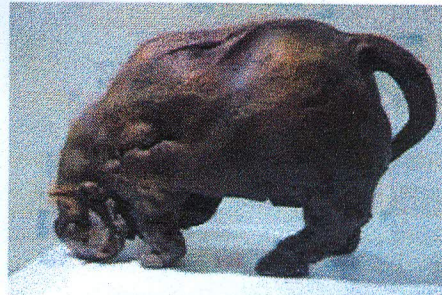
Taureau, bronze, 24 x 45 x 21 cm

d'une autre tête ancienne qui va tomber. «Ce n'est pas un enfermement, dit-il, c'est le vivant qui apparaît derrière la mort, c'est le renouveau, l'émergence.» Dans un autre visage, Antonio , l'expression, le regard sont dus à un accident de cuisson: ce personnage a passé l'épreuve du feu.