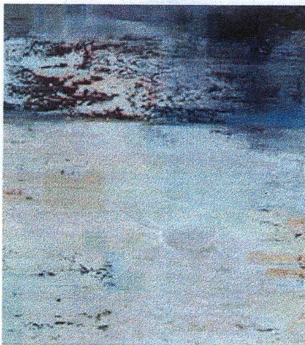
Debatty: Spitzberg, 2008, huile sur toile, 100 x 90 cm

Borgeaud a aussi travaillé une série de crânes, de têtes, par exemple une formidable métamorphose, sorte de mue d'un nouveau visage naissant à travers les restes