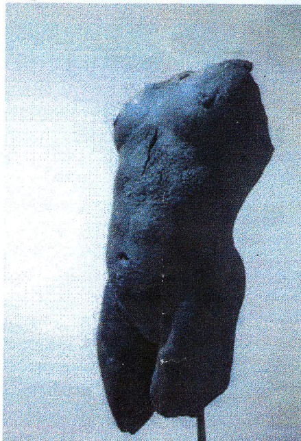
Tronc noir I, grès au manganèse, 45 x 26 x 17 cm

Me vient l'idée, qui n'est pas celle de Borgeaud, que ces corps ont subi les attaques du temps, comme une érosion, qu'ils sont analogues à des vestiges antiques. «C'est vrai, dit-il, ce corps est déjà bouffé par le temps, il n'est plus tout jeune, il est dans sa « charmellité fragile .»